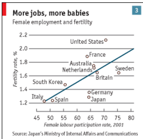
Graphe 3 : taux de fertilité en fonction du taux de participation féminin

Il semble bien que si une participation féminine à l'économie élevée est soutenue par le bon type de politiques, elle n'aura pas de conséquences négatives pour la natalité. Afin de pouvoir pleinement profiter de leur réservoir de talents féminins, les gouvernements doivent supprimer les obstacles qui rendent difficile aux femmes de concilier vie professionnelle et parentalité . Cela veut dire établir des congés maternité, ouvrir des crèches, assouplir les horaires de travail et réformer les aspects de la fiscalité et des prélèvements sociaux qui constituent des obstacles à l'emploi des femmes.